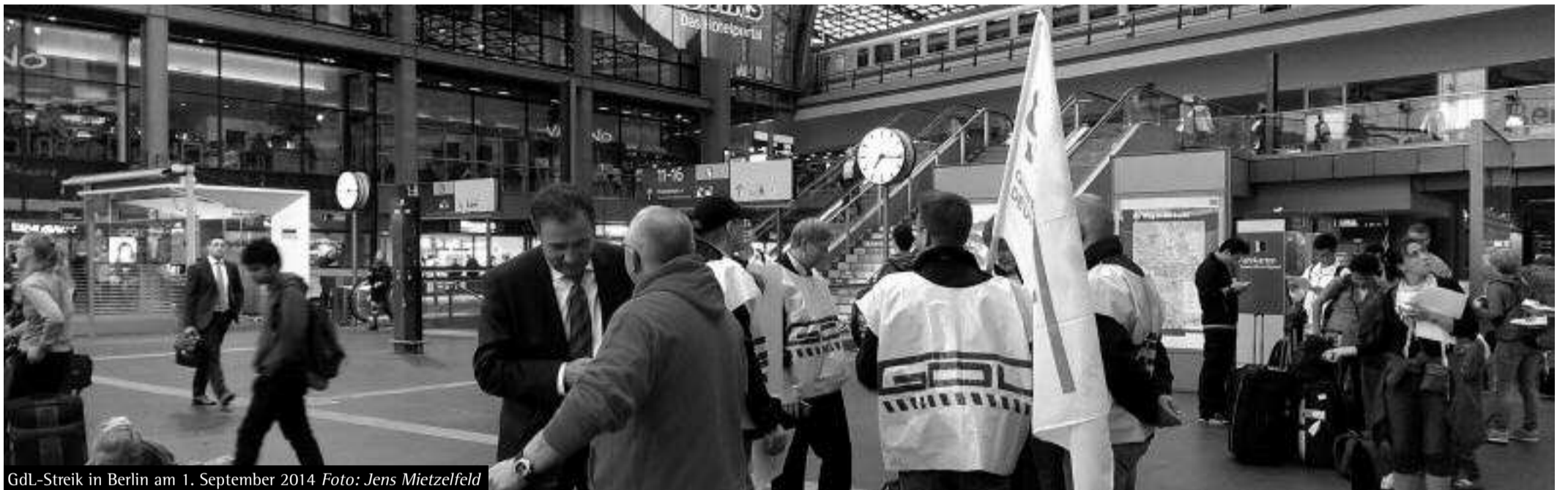
GDL-Streik in Berlin am 1. September 2014

Die öffentliche Debatte um die Streiks der GDL ist geprägt von einer Demagogie, bei der sieben Totschlagargumente eine zentrale Rolle spielen.