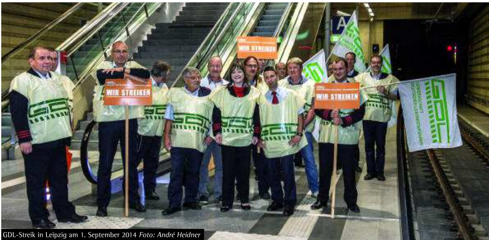
GDL-Streik in Leipzig am 1. September 2014

Können Sie uns mal sagen, was Lumpenjournalismus ist?