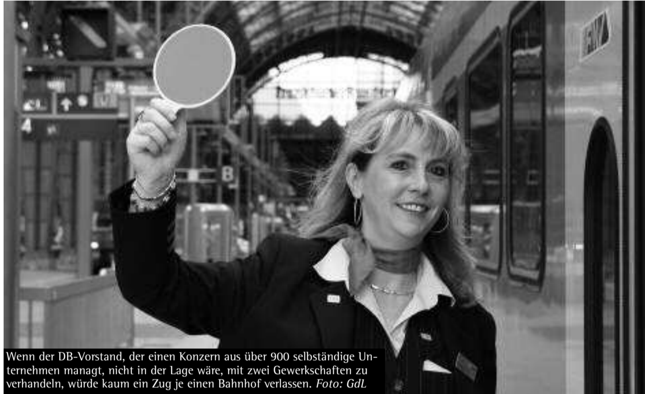
Wenn der DB-Vorstand, der einen Konzern aus über 900 selbständige Unternehmen managt, nicht in der Lage wäre, mit zwei Gewerkschaften zu verhandeln, würde kaum ein Zug je einen Bahnhof verlassen.

Als ehemaliger Gewerkschaftssekretär der damaligen Gewerkschaft Handel, Banken, Versicherungen (HBV im DGB) in Baden-Württemberg war ich von 1979 bis 2001 mit diesem Thema vertraut. Bis 1976 hatten sich in jeder Tarifrunde des Einzel- und Großhandels sowie Buchhandel/Verlage die HBV und die Deutsche Angestellten-Gewerkschaft (DAG), die nicht dem DGB angehörte, irgendwie über ein gemeinsames Vorgehen mit den Arbeitgebern verständigt. Wegen andauernder Kungeleien der DAG mit den Arbeitgebern erklärte 1976 die HBV-Landesbezirkskonferenz die DAG per Beschluss zur „gegnerischen Organisation“, mit der es keine gemeinsamen Tarifverhandlungen mehr gibt. Das war dann so bis 2001, als HBV und DAG zwei der fünf Gründungs-gewerkschaften von ver.di wurden.