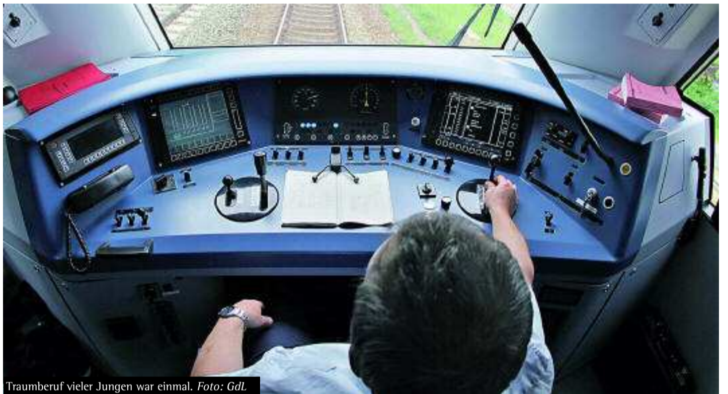
Traumberuf vieler Jungen war einmal.

Vor diesem Hintergrund darf es nicht verwundern, wenn die Forderung nach einer strikten Begrenzung der Überstundenzahl pro Jahr und nach einem Abbau